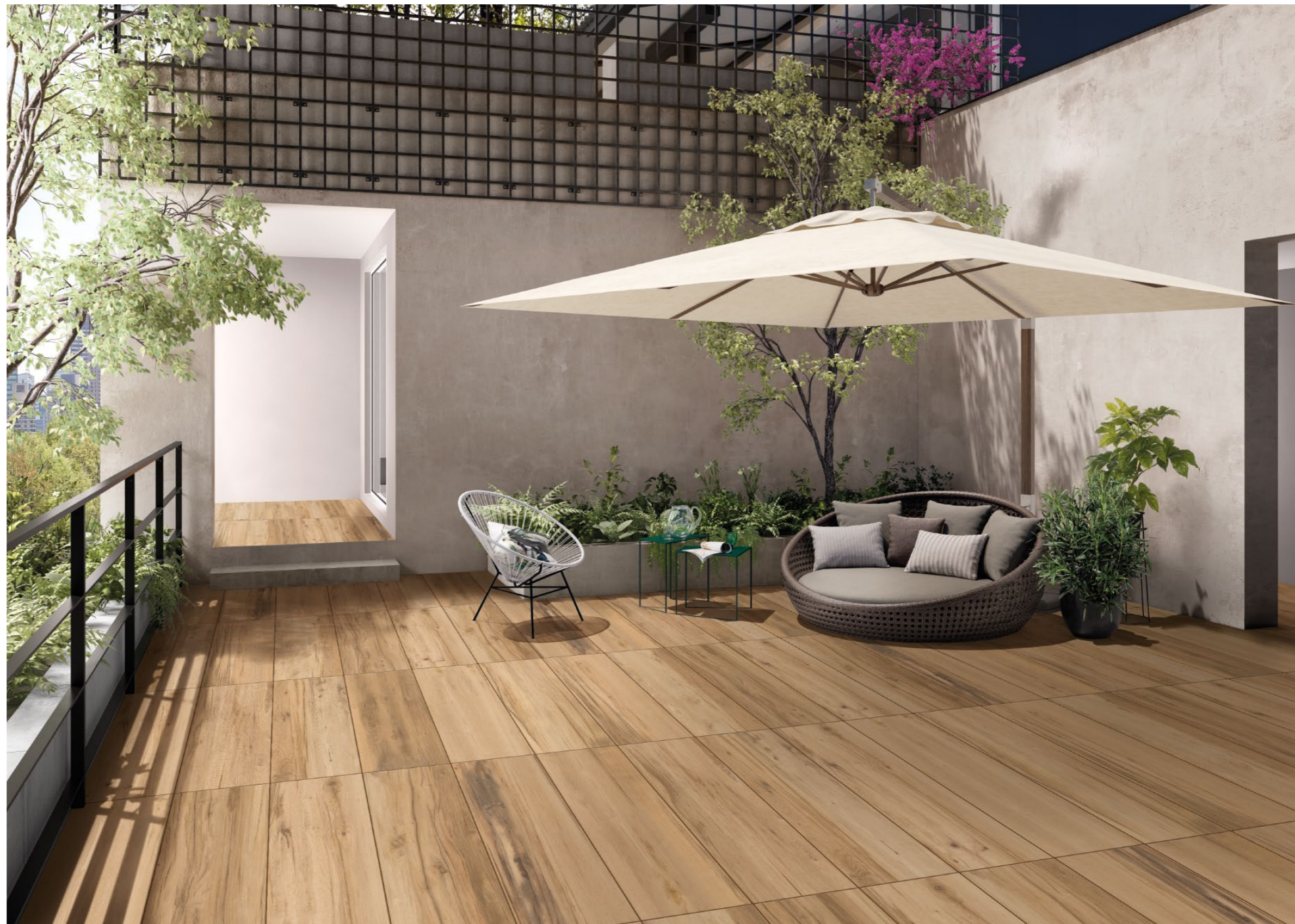
Quercia Recuperata Nat. Rett. - 40x120 - 15 3/4 x 47 1/4 20MM

Provoak 20MM delivers the ideal combination of exquisite appearance and outstanding technical performances in the most widely varying outdoor locations. Paths, pavements and other outdoor solutions that merge perfectly into the surrounding environment and seamlessly continue indoor design schemes can be created with a material offering exceptional resistance to loads, weather and other atmospheric factors. Easily installed dry on grass, sand and gravel, Provoak 20MM can also be glued to concrete screeds for vehicle-resistant pavings, or for other projects in commercial or public contexts with heavy traffic, and is perfect for raised floors. Provoak 20MM enables stylish design solutions while meeting all the technical demands of contemporary architecture.